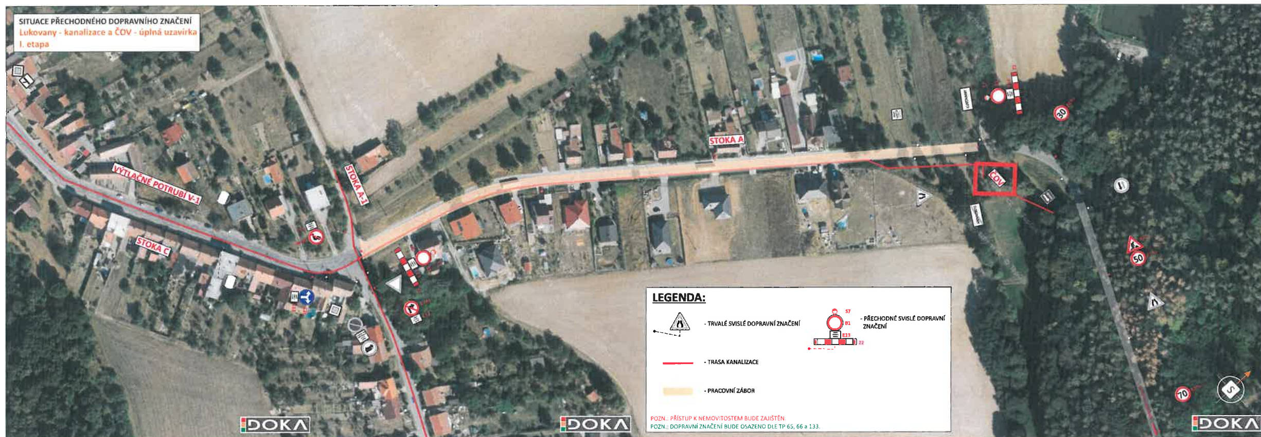
SITUACE PŘECHODNÉHO DOPRAVNÍHO ZNAČENÍ Lukovany - kanalizace a ČOV - úplná uzavírka I. etapa

MĚSTSKÝ ÚŘAD ROSICE odbor dopravy 665 01 ROSICE